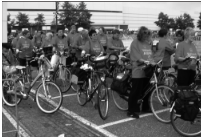
De start, tezamen met 9000 mensen was een grote happening!

Moe maar voldaan werd dan toch nog de finish bereikt. Samen met alle deelnemers is voor maar liefst € 600.000,- bij elkaar gefietst voor het Koningin Wilhelmina Fonds! Zo ziet u maar weer: ook hiervoor voert de ABW actie! ■